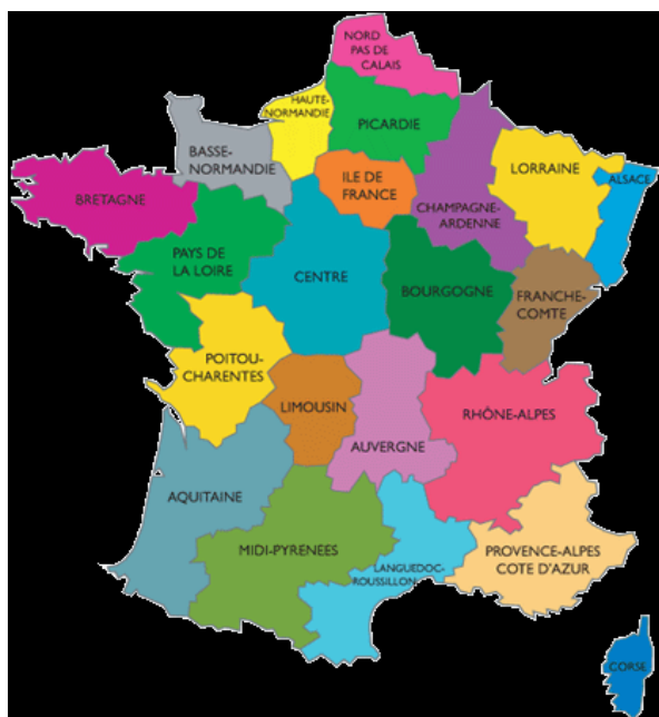
Figure 1 : Duclair se situe en Haute Normandie