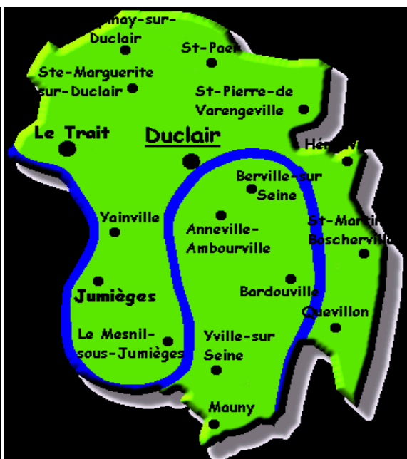
Figure 2 : Duclair est le chef lieu du Canton de Duclair

La ville de Duclair est située dans le département de la Seine-Maritime de la région de la Haute-Normandie. La ville de Duclair appartient à l'arrondissement de Rouen et au canton de Duclair (cartographie ci-dessus), un canton qui comporte plus de 22 000 habitants en son sein. Depuis peu de temps (1 er janvier 2010), la commune de Duclair fait partie de la CREA (Communauté d'agglomération Rouen – Elbeuf – Aestreberthe). La CREA est une nouvelle organisation des communes les plus ruralisées du secteur, afin que celles-ci puissent bénéficier d'une plus cohérente mutualisation des moyens.